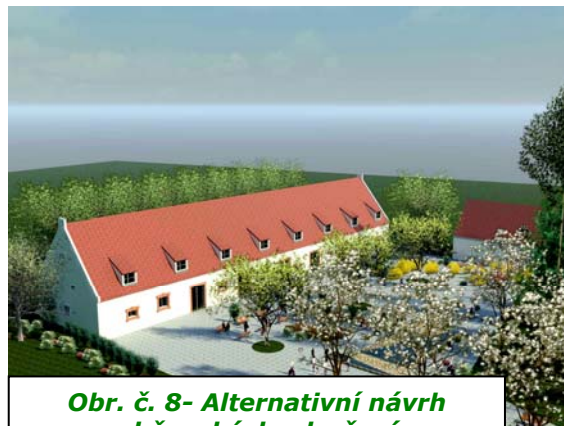
Obr. č. 8- Alternativní návrh občanských sdružení k rekonstrukci areálu statku