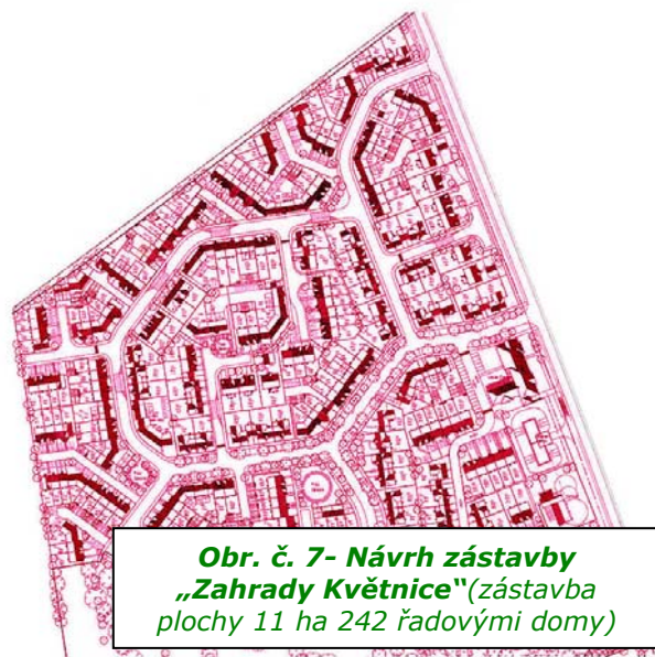
Obr. č. 7- Návrh zástavby „Zahrady Květnice“ (zástavba plochy 11 ha 242 řadovými domy)

Vážení členové zastupitelstva, na základě podpory občanů, níže podepsaných k této petici, Vás ve smyslu práva petičního vyzýváme k bezodkladnému uvedení příslušných opatření vyplývajících z petice v účinnost, zejména v otázce č. 3 – schválení změny územního plánu s příslušnými regulativy (dle usnesení ZOK 1/5/2009 ze dne 16.4.2009). Současně Vás tímto žádáme o jmenování paní Ing. Markéty Štrosové do funkce „určeného zastupitele“ pro spolupráci s pořizovatelem územního plánu a to na nejbližším zasedání zastupitelstva.