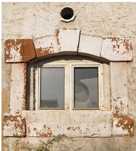
Obr. č. 3 až 6 – Stávající budovy a zeleň v areálu statku

(zleva budova kde je současný obecní úřad se vzrostlými stromy, vila z 20. let, budovy v areálu, kamenné ostění okna)