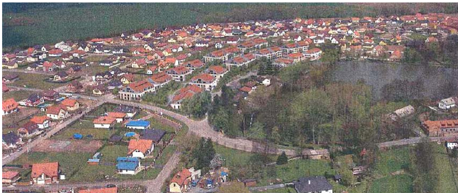
Obr. č. 2 – Třetí návrh urbanisticko – architektonické studie zástavby „Residence Flores“ od jihu (zástavba plochy 3 ha v areálu statku a prostranství jižně od statku 15ti 4 a 5ti patrovými domy s celkem 390ti byty)

Navržený urbanisticko-architektonický koncept patnácti čtyř až pětipodlažních budov je svou výškou, objemem, počtem obyvatel i automobilů pro místní lokalitu nevhodný (viz. obr. č. 2) . Svou koncepcí by narušil stávající vesnický ráz obce a v konečném důsledku by přinesl nepřiměřené zahuštění zástavby , výrazné zvýšení silniční zátěže, hlučnosti a exhalací . Vzhledem k překotnému rozvoji obce by nebyly realizací tohoto záměru dostatečně naplněny společenské a kulturní potřeby obyvatel obce, jelikož plánovaný objem občanské vybavenosti záměru by postačoval právě jen obyvatelům samotného záměru.